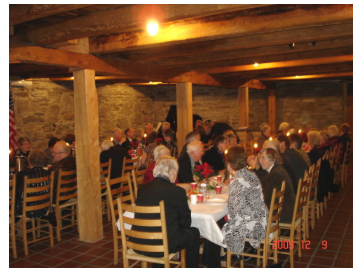
Her er alle samlet.

Vi fikk servert rømmegrøt med spekemat, og/eller risgrøt for de som foretrakk det. Alt smakte godt.