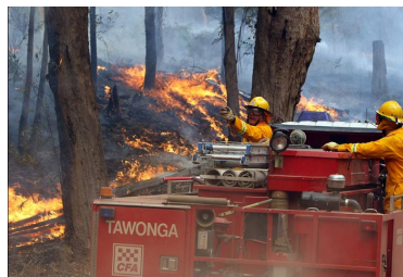
Bilde fra en av skogbrannene i Australia. Hentet fra internett.