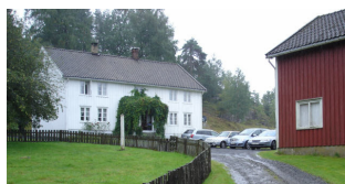
Våningshuset på Solheim gård