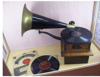
Victor Talking Machine

Vi var i ekstase. Ble aldri trett av å høre. Senere kom graphaphonen (en forbedret utgave av fonografen), så kom Victrola (The Victor Talking Machine Company).