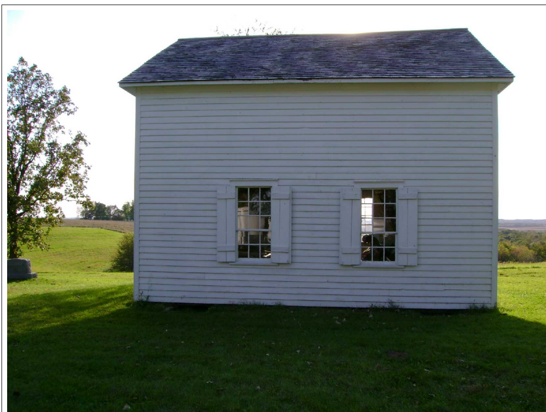
Et fast besøkssted på «Ryfylketuren». Mange fra Ryfylke ble «settlere» her.

Det er et eksempel på den spesielle Skandinaviske tømmerhusarkitektur, og med dets uforstyrrede plassering blir det et bemerkelsesverdig panorama. Denne lille historiske konstruksjonen og det fine miljøet inviterer til refleksjon i sin enkelthet. Det blir gitt en ekstra dimensjon og fokus, av det omkringliggende land, som er holdt åpent og fritt for annen utvikling.