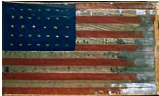
Fanen til 82 nd Illinois Infantry Regiment, nå utstilt i Springfield, IL.