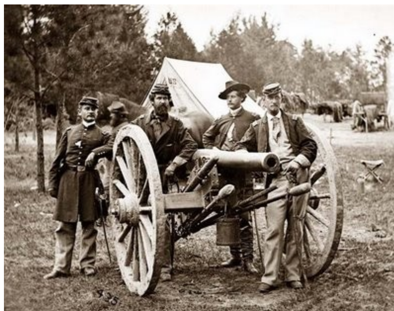
Kanonmannskap ved et av nordstatenes lette artilleribatterier ca. 1863.